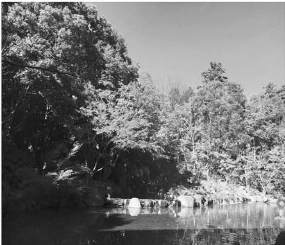
【池泉のある日本庭園】

毎年恒例となっている忘年会が晴天のなか12月3日(日)に開催されました。場所は木更津市のオークラアカデミアパークホテルです。会場となった和食堂山里の窓からは大きな池泉が見え、少し紅葉した木々が水面に写りこみ何とも言えない風情でした