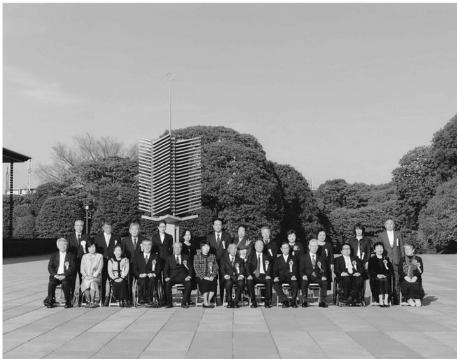
皇居内にて集合写真

連合会の活動と並行し、障害関係団体連絡協議会協議委員や全国バリアフリー会議メンバー、障害者の地域生活に関する研究委員などにも就任した。またピアマネジャー養成研修事業においては、準備評価委員として活躍し、168名の研修修了者を誕生させた。現在は千葉県支部広報及び情報通信担当として活動している。