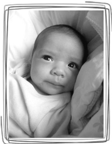
生まれたて しづく

関東でも積雪があったり、日本海側はものすごい雪に見舞われたり、インフルエンザが猛威を振るう中体調など崩されていますか？ 何とかここを乗り越えて春が待ち遠しい限りですよね。