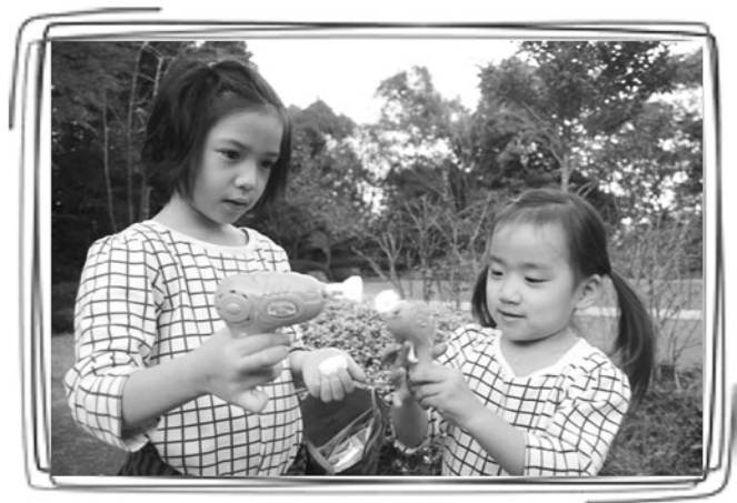
シャボン玉大作戦