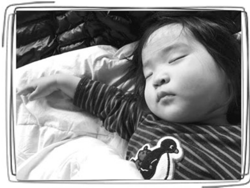
おやすみなさい(๑)ノ

はよく考えるんだよね。 でもいくら考えてもその答えはいまではない、僕 達も子供達と成長して行きながら考えて、行動し ていく事なんだよね。