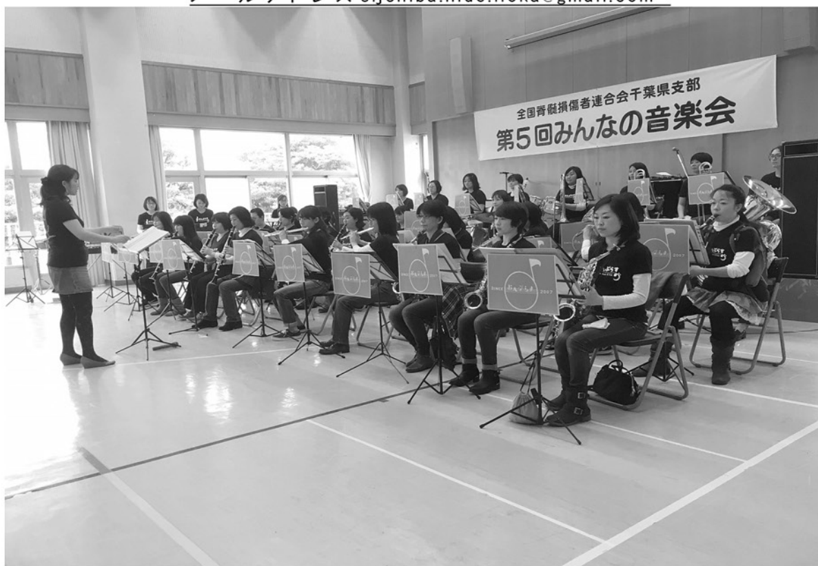
第5回みんなの音楽会

メールアドレス = sijchiba.hide.iiooka@gmail.com