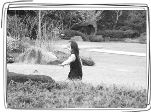
お姉ちゃんを追いかけて…