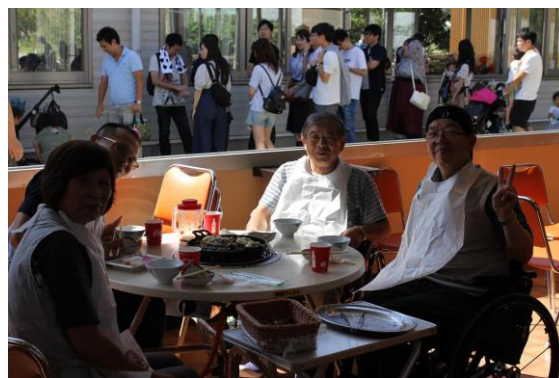
千葉県支部の円熟の域に達した方々