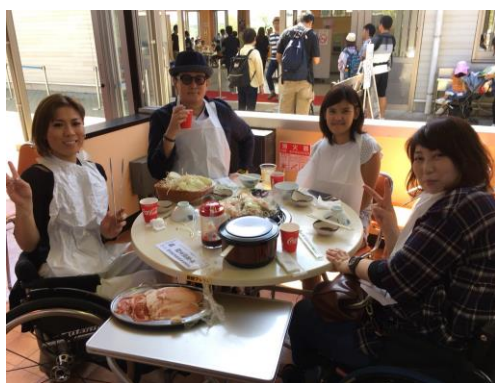
千葉県支部の女性陣+α