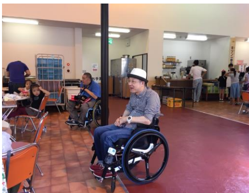
飯岡支部長の挨拶