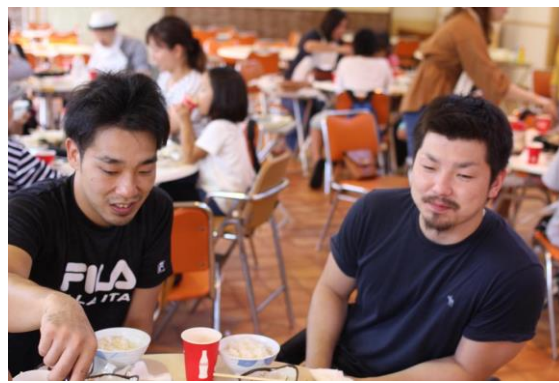
千葉県支部の若手ツーショット