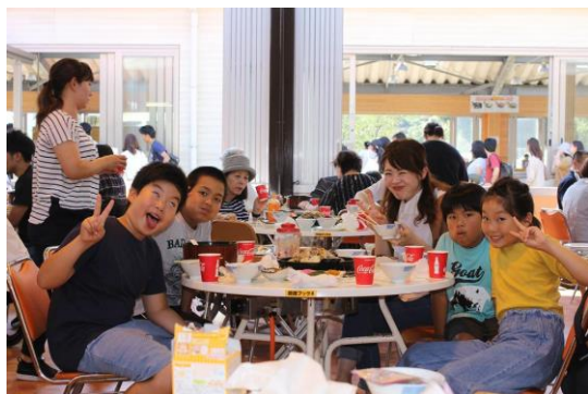
参加いただいたお子様方