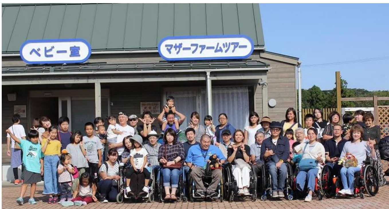
於：マザー牧場ジンギスカンガーデンズ (第26回バーベキュー昼食会 期日：平成30年9月23日)

ホームページアドレス = http://www.normanet.ne.jp/~ww101938/ メールアドレス = sijchiba.hide.iioaka@gmail.com