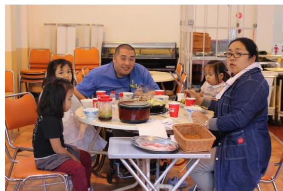
露崎家 (たくさん食べてるかな?)