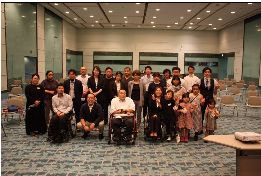
於：かずさアカデミアホール 2F (支部総会 期日：令和3年9月5日)