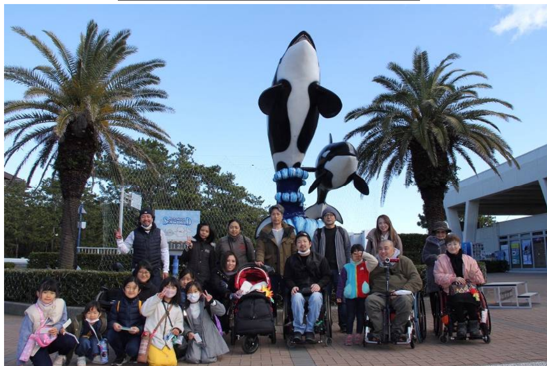
於：鴨川シーワールド (冬の遠足 in 鴨シー 期日：令和3年12月19日)