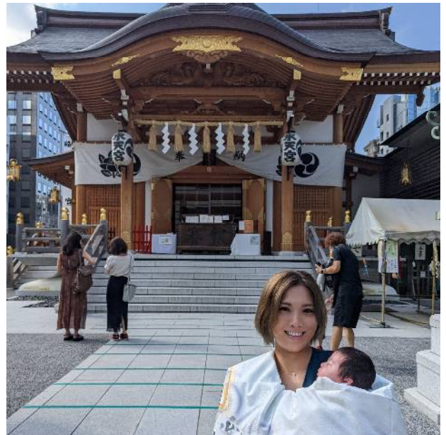
お宮参りは人形町水天宮で！ 祈禱する場所もバリアフリーです。