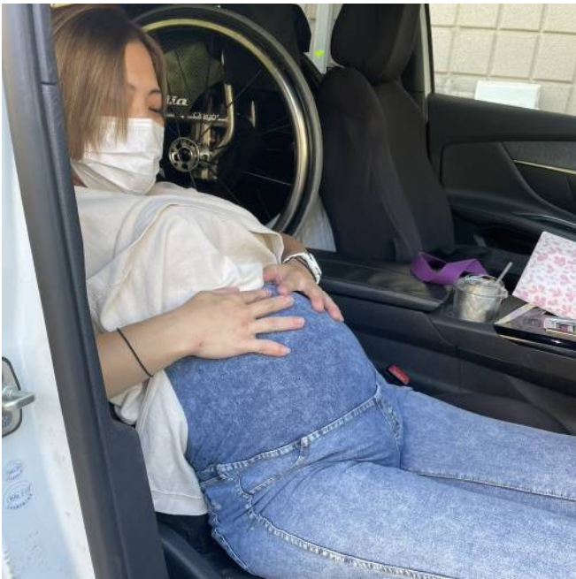
カートランスは臨月でも自力でいきました！