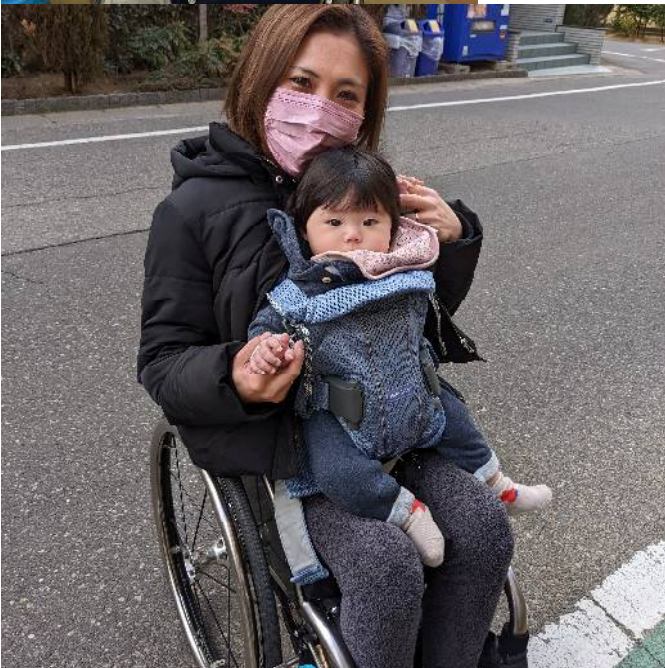
現在のりんたろう。 2人で出かける時はこのスタイル！