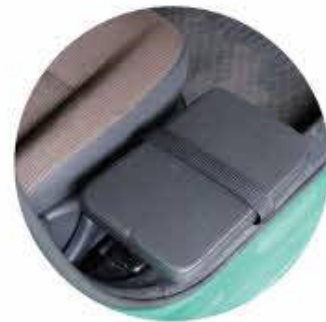
トランスフォーボード