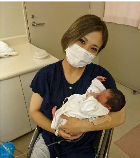
2626gとコンパクトに産まれました！