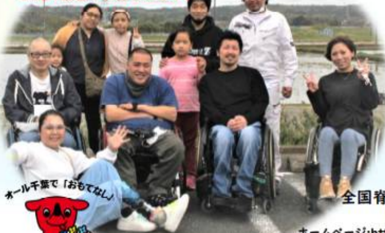
ホール千葉で「おもてなし」

※ピアサポーターは医師やカウンセラー等ではありません。 医学的・専門的な相談やカウンセリングは行いません。 私達の経験をお話します。