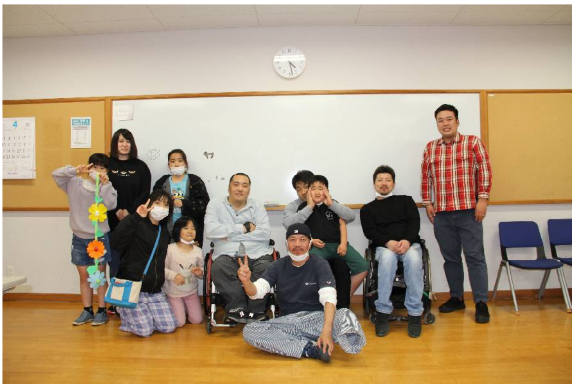
於：市原三和保健福祉センター(サンハート)